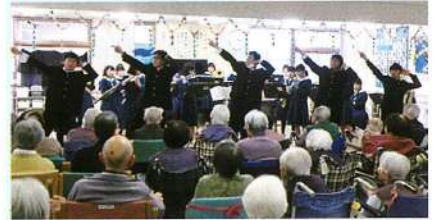
ボランティア活動 (アムニティ月岡訪問)