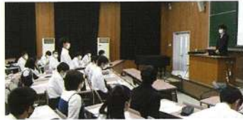
富山大学経済学部