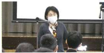
分科会 (OBや保護者を講師に迎えて)