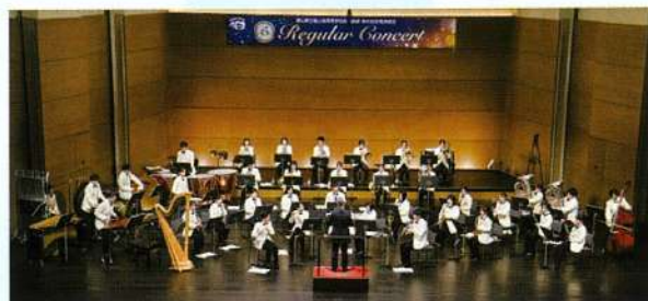
吹奏楽部定期演奏会