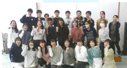
イングリッシュ・キャンプ