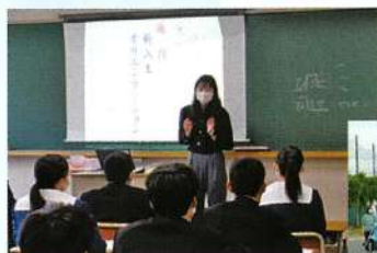
新入生オリエンテーション