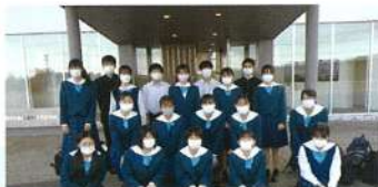
プレステージインターナショナル