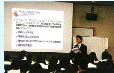
国際理解セミナー