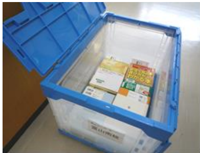
週に1度、県立図書館に頼んだ本が届きます。

学校図書館は「学習センター」「読書センター」「メディアセンター」の3本柱で構成されています。富山南高校図書館は、県内の高校で唯一、 富山県立図書館の連絡車が定期巡回しています。