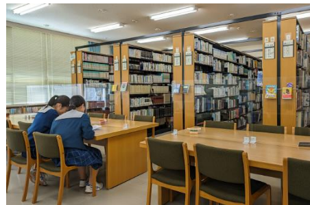
昼休みや放課後は読書や学習で毎日にぎわいます。